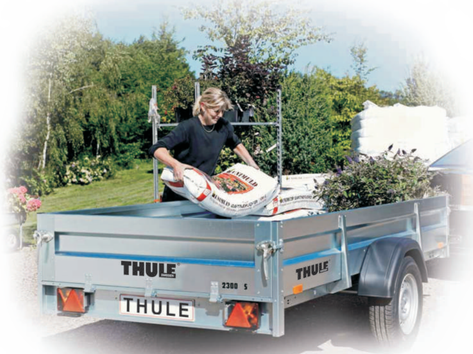
Brenderup 2300 S.

Technické údaje a úplný seznam doplňkového příslušenství naleznete na poslední stránce s tabulkou. Dodáváme také modely s jinou celkovou hmotností a hliníkovými bočnicemi nebo relingem – obraťte se na nejbližšího dealera (úplný seznam na stránkách: www.brenderup.pl )